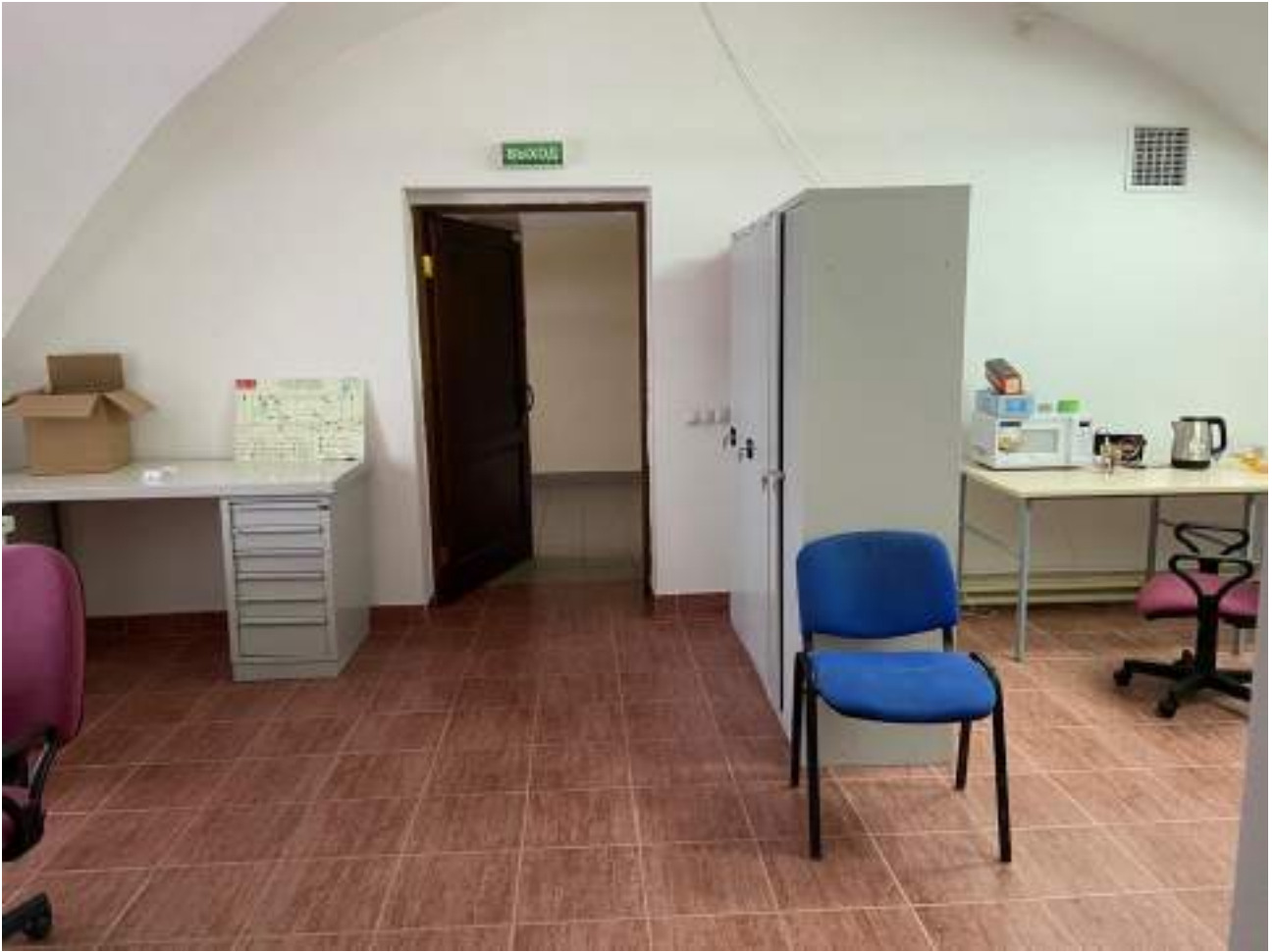
Рисунок 4.8 Кафе