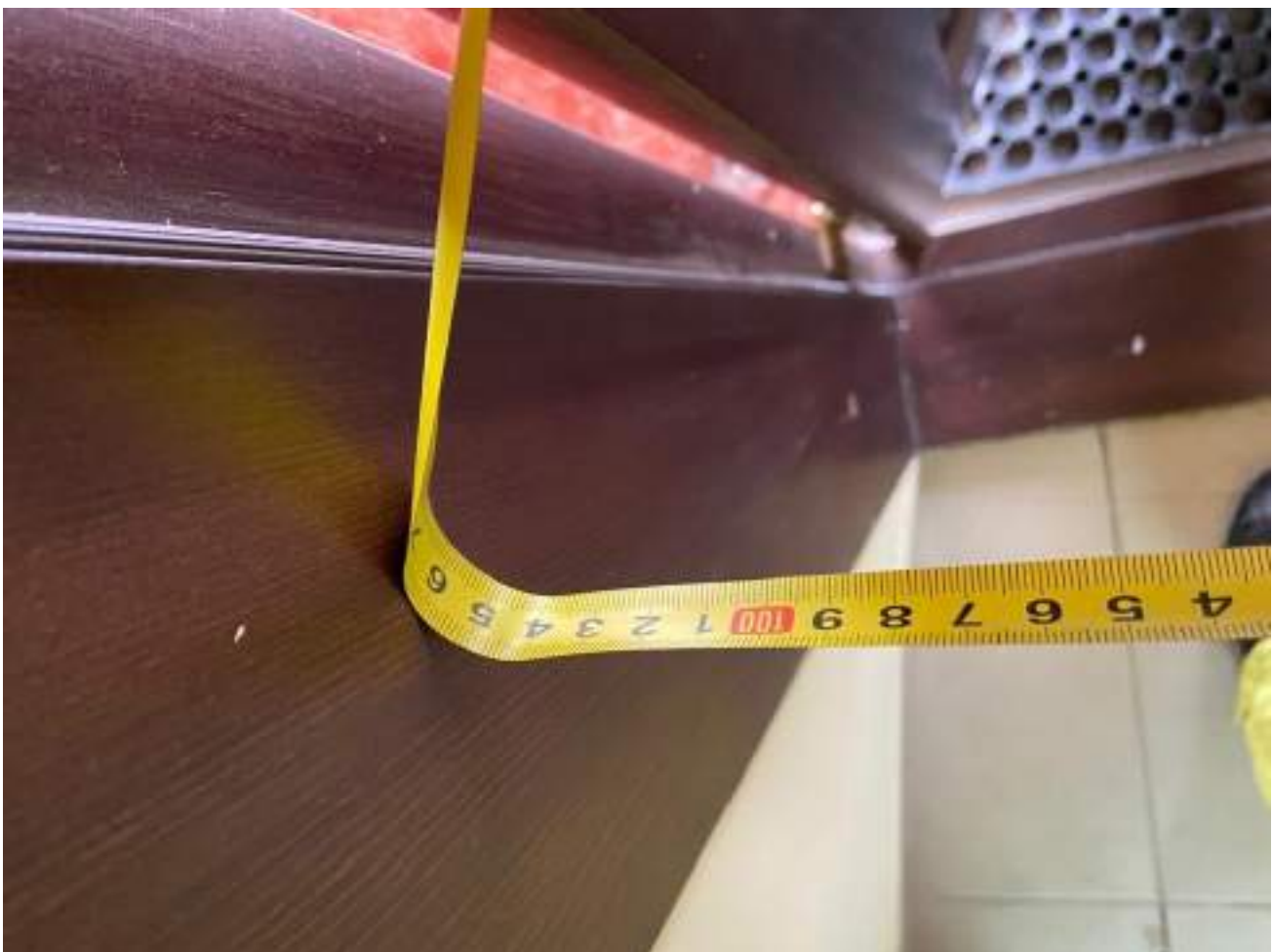
Рисунок 2.6 Ширина дверного проема 104 см