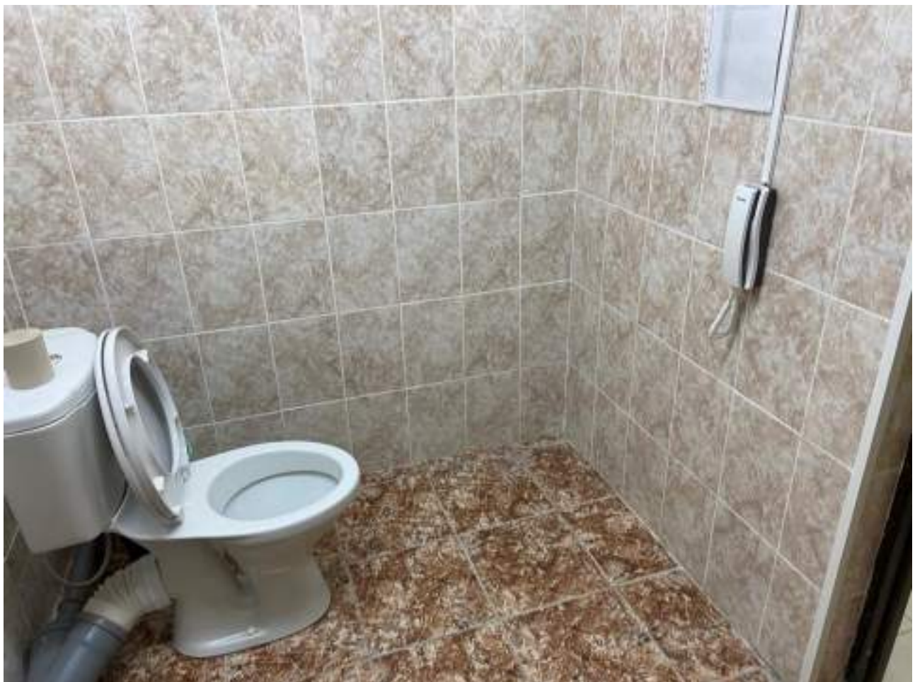
Рисунок 5.4. Система двусторонней связи с дежурным