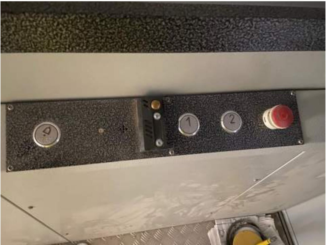
Рисунок 3.9 Кнопки лифта продублированы шрифтом Брайля