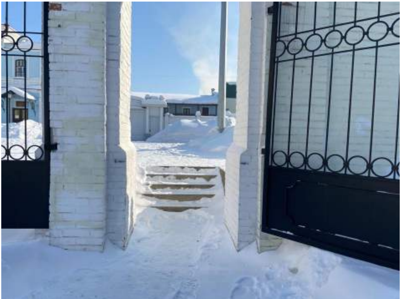
Рисунок 1.4 Вход на территорию объекта