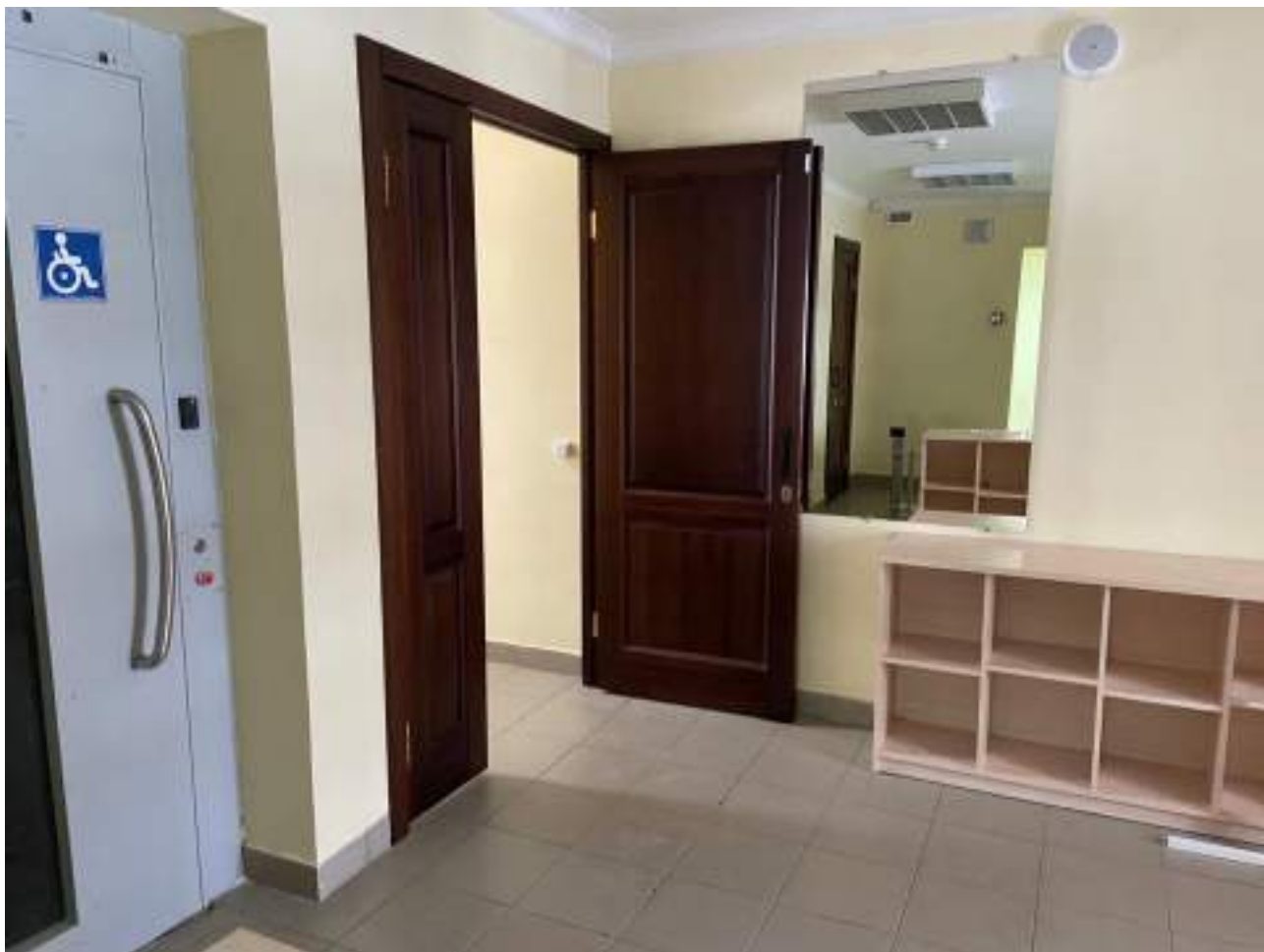
Рисунок 3.3 Пути движения на первом этаже