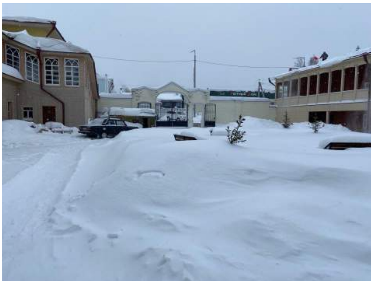
Рисунок 1.8 Пути движения на территории