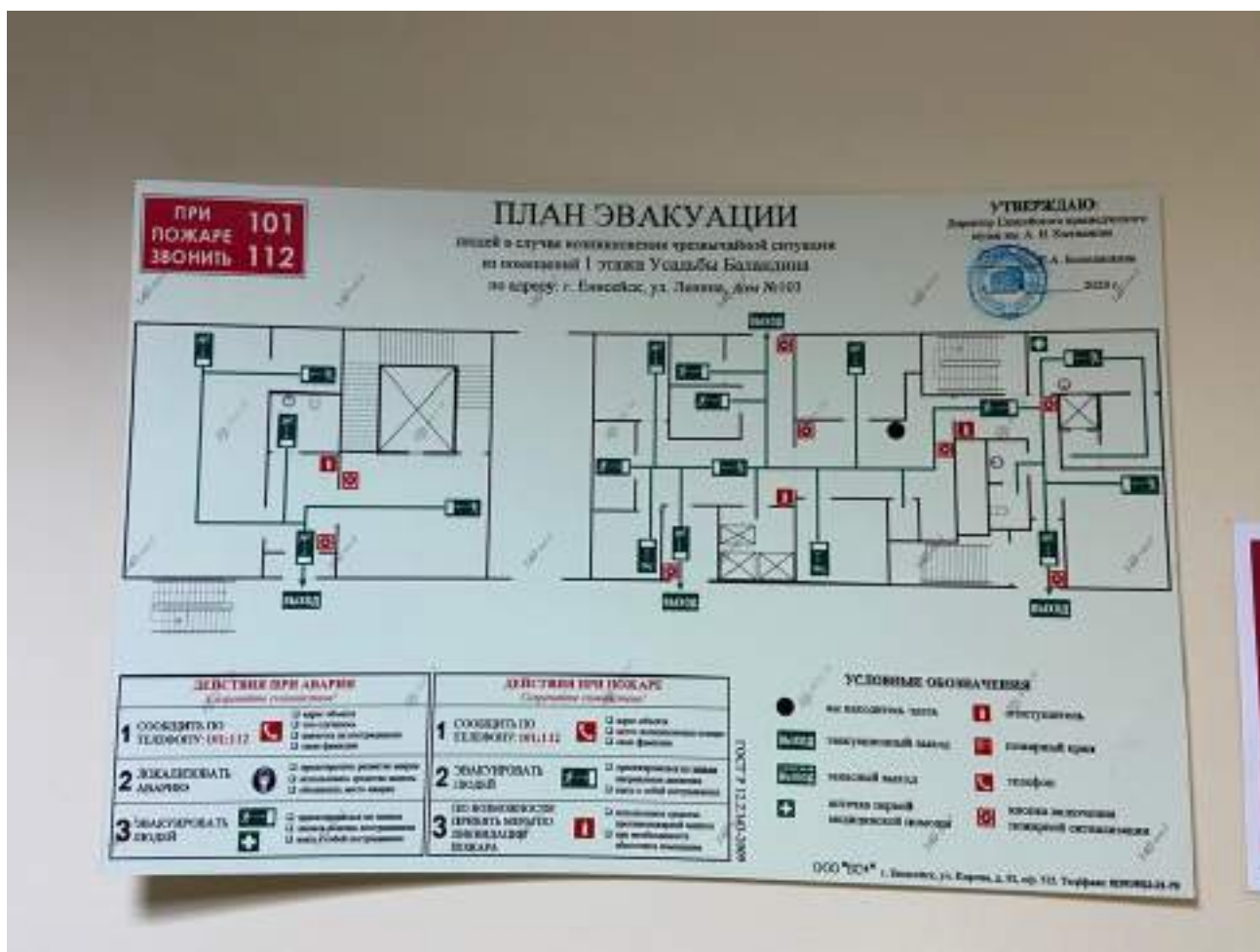
Рисунок 6.1. План эвакуации 1 этажа

При первом посещении объекта инвалиду важно понять, как можно до него добраться, какова его степень доступности, имеется ли на объекте персонал, который может оказать ему помощь, где расположены средства связи с администрацией, есть ли доставка услуги на дом и пр. Может потребоваться описание планировки объекта. Следует разместить указанную информацию на сайте объекта и предоставить пользователю Пояснение по телефону. Информация должна быть представлена в удобном понятном формате, в том числе для слабовидящих.