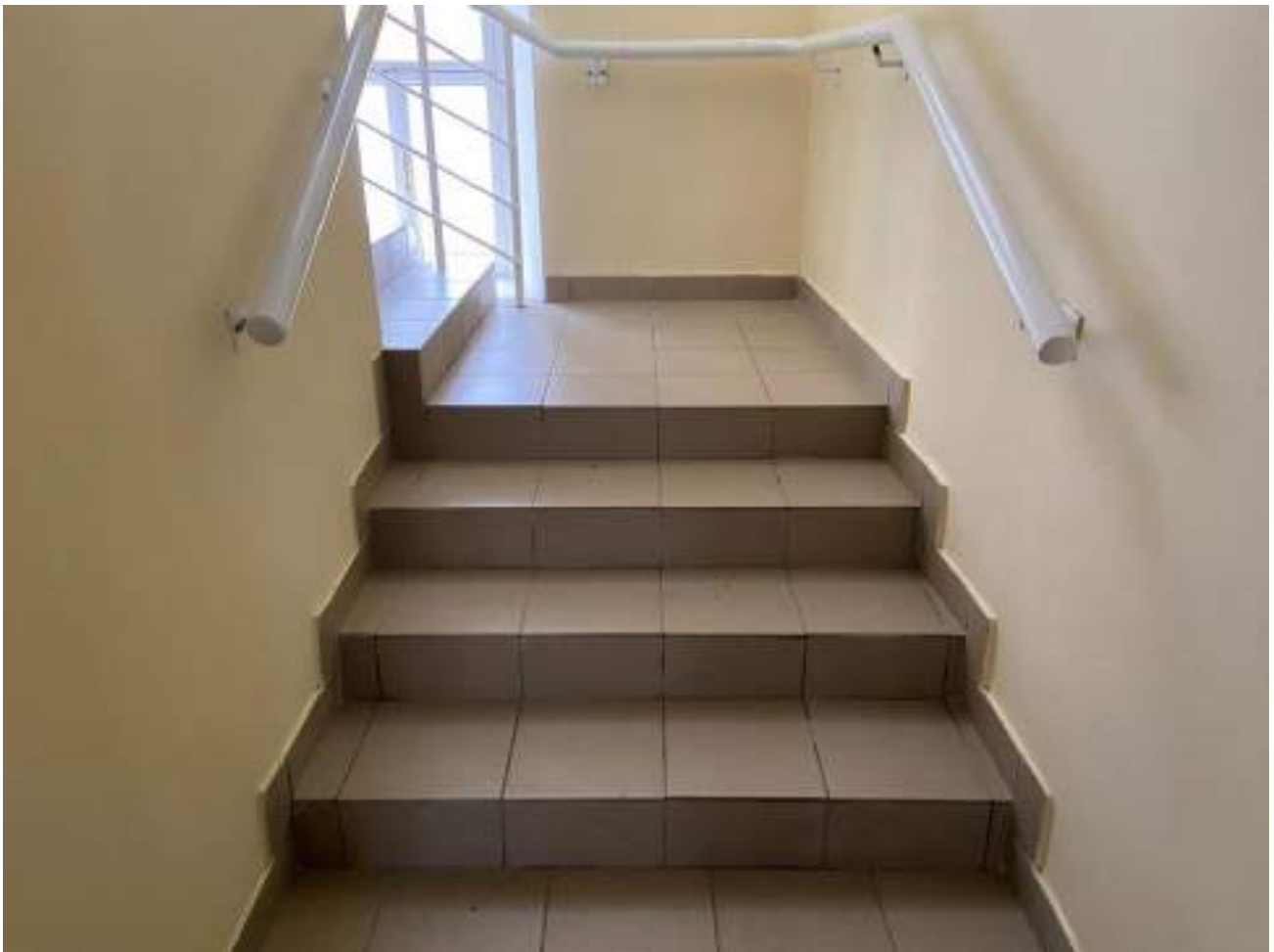
Рисунок 3.5 Лестничный марш внутри здания