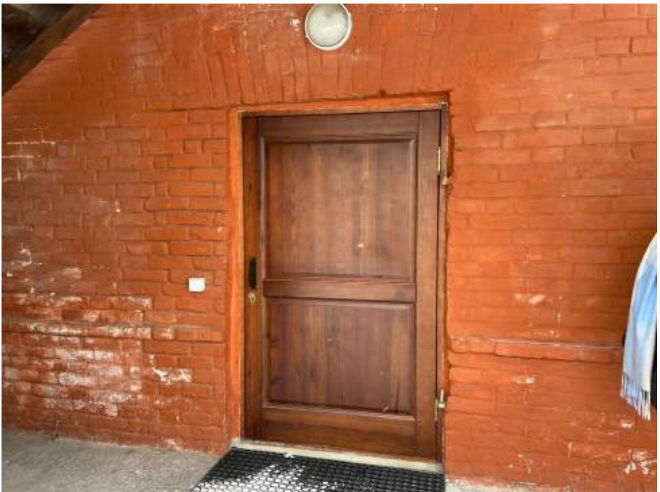
Рисунок 2.4 Вход в здание