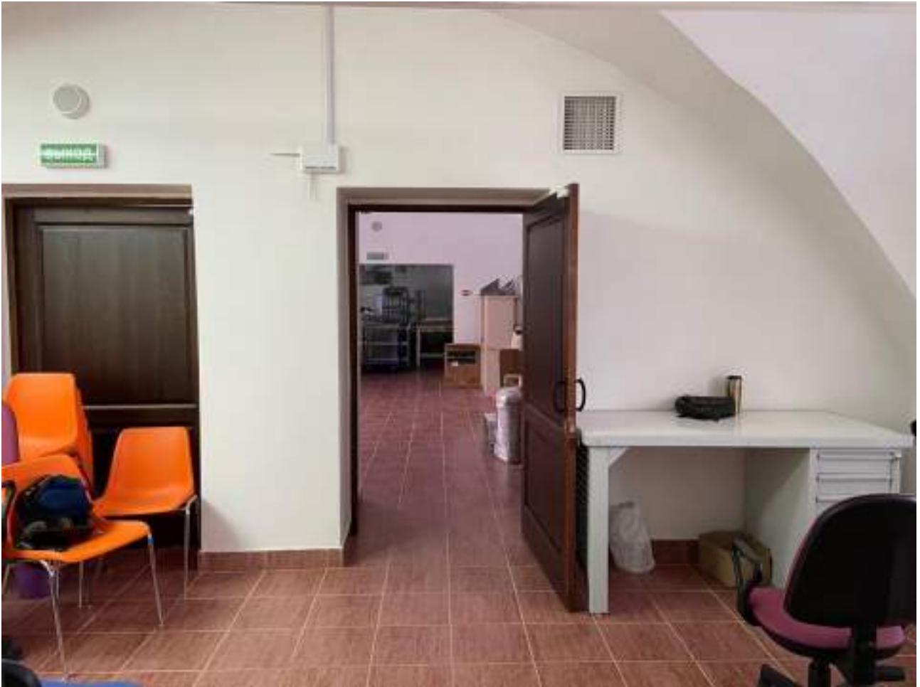
Рисунок 4.6 Кафе на втором этаже