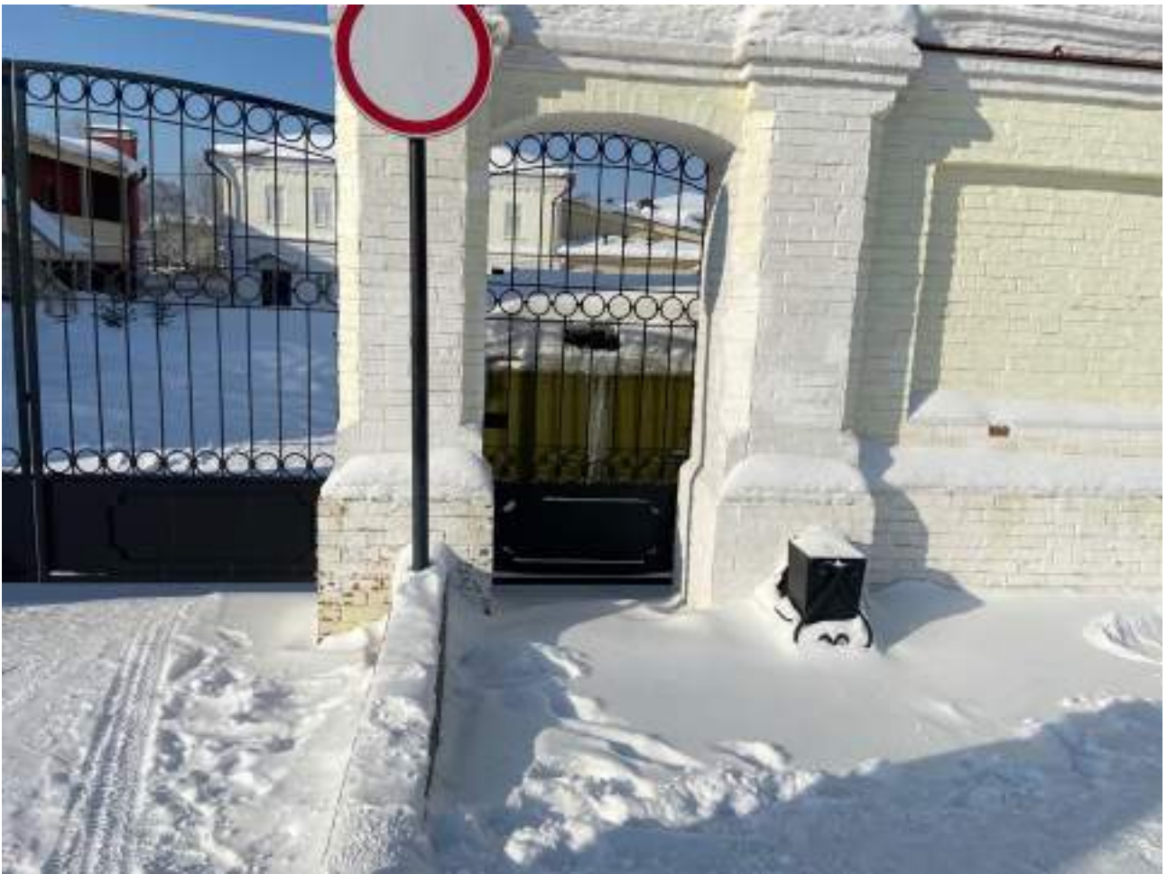
Рисунок 1.1 Вход на территорию объекта