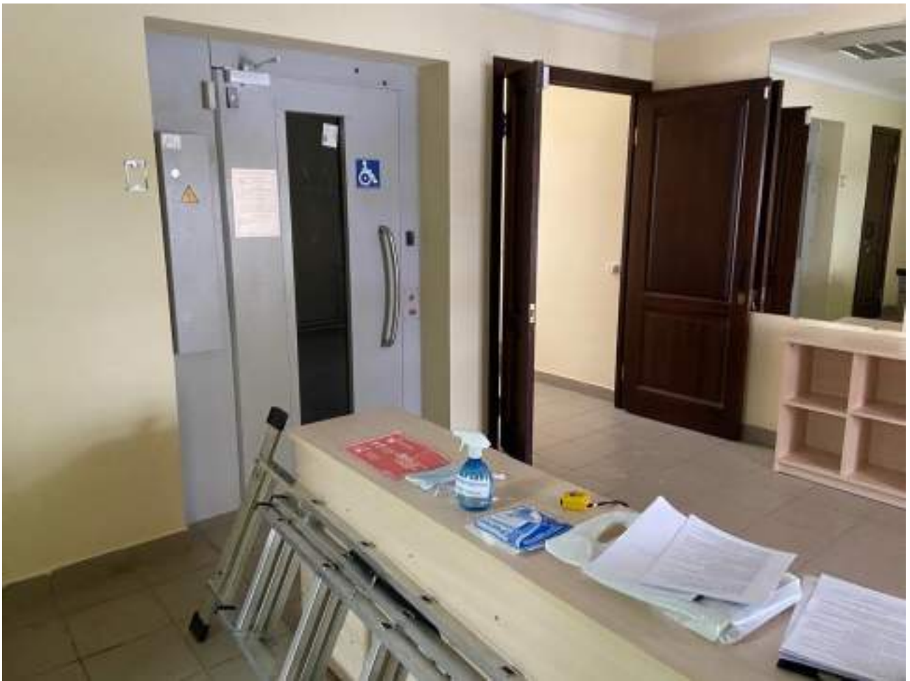
Рисунок 3.1 Вестибюль на первом этаже