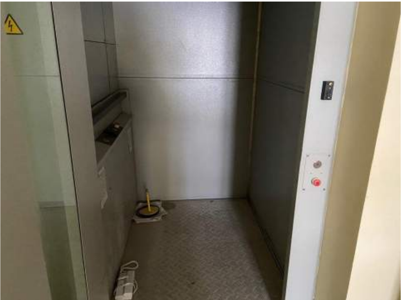
Рисунок 3.10 Лифт