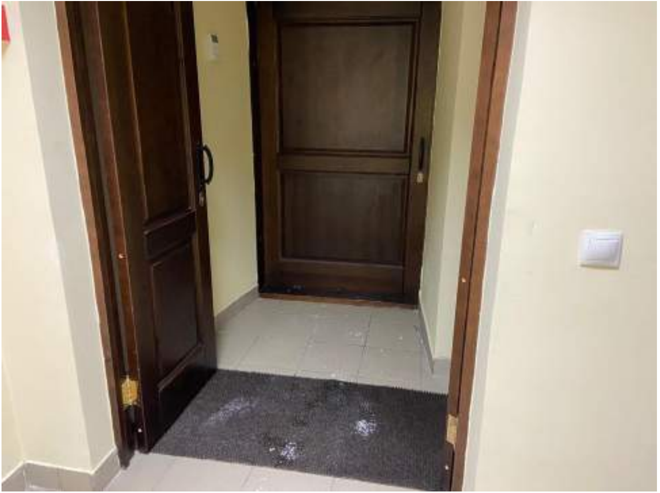
Рисунок 2.7 Тамбур