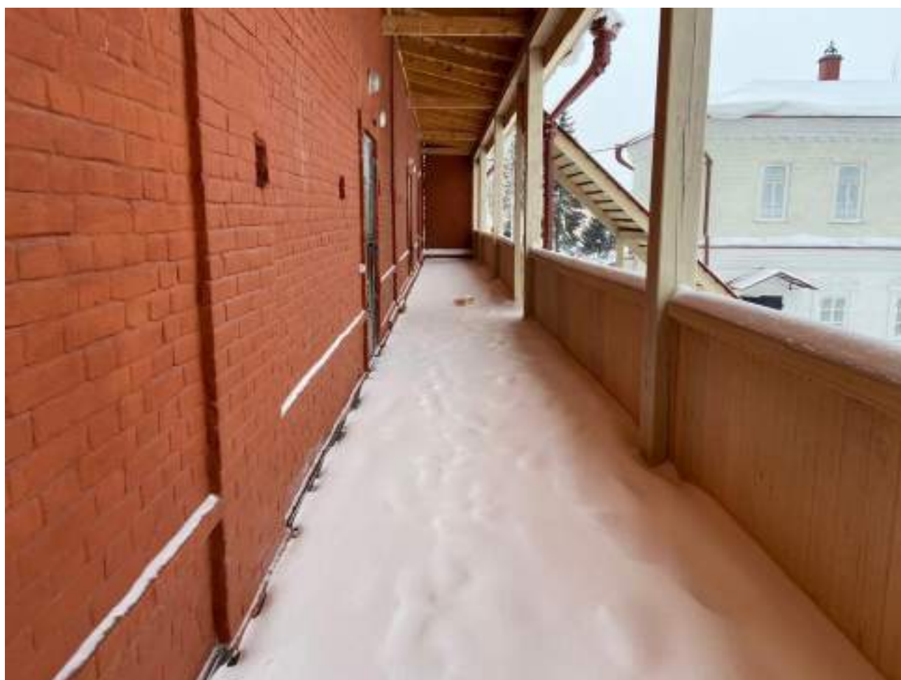
Рисунок 3.14 Эвакуационный выход на втором этаже