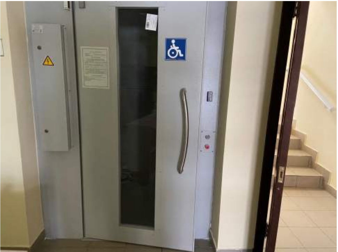
Рисунок 3.8 Лифт