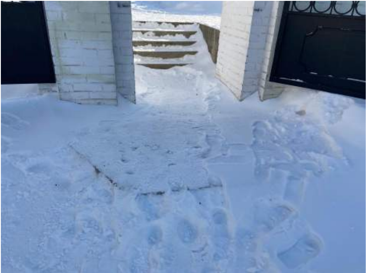
Рисунок 1.10 Лестничный марш при входе на территорию