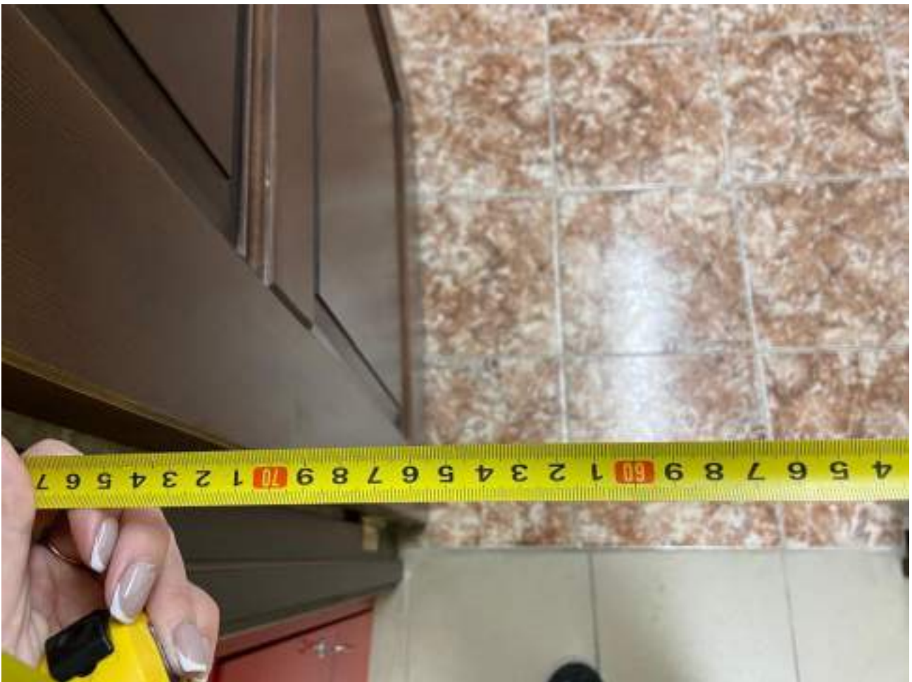
Рисунок 5.2. Ширина дверного проема 77 см