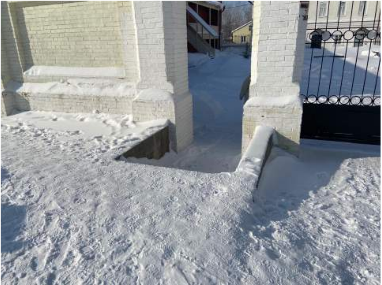
Рисунок 1.3 Вход на территорию объекта