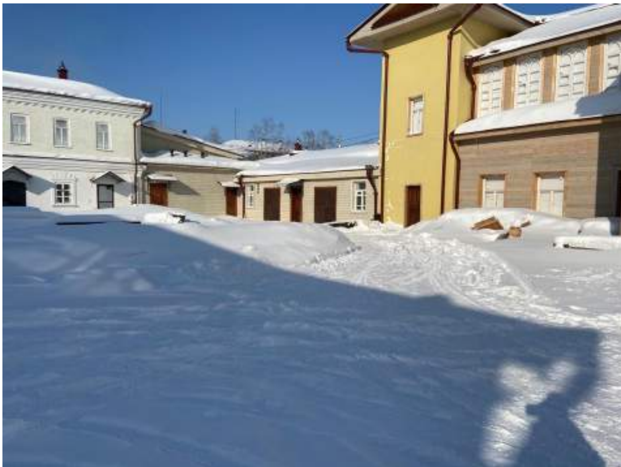
Рисунок 1.7 Пути движения на территории