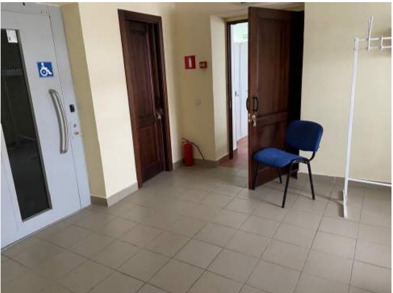
Рисунок 3.2 Пути движения внутри здания