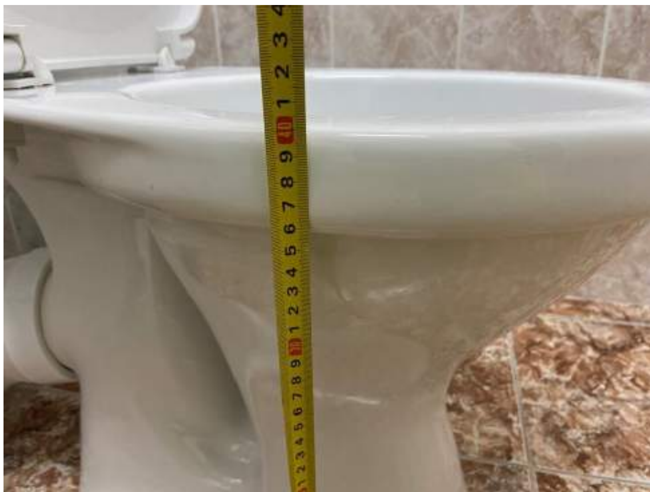
Рисунок 5.6. Высота унитаза 40 см