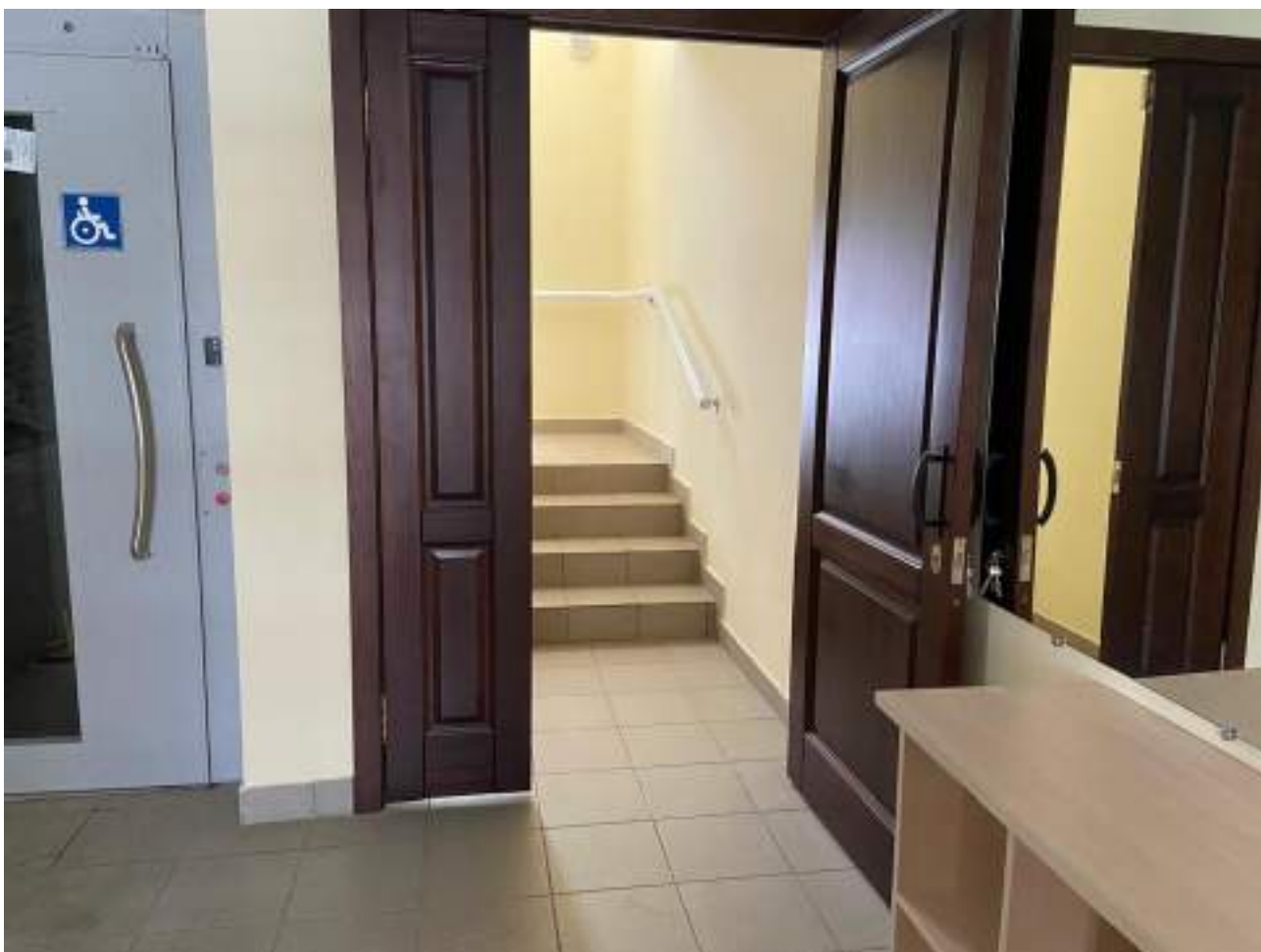
Рисунок 3.4 Двери на путях движения. Выход на лестничный марш