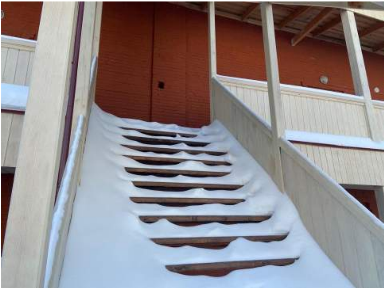
Рисунок 2.1 Лестничный марш при входе в кафе