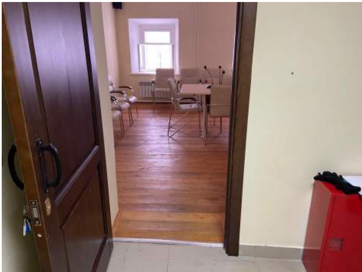
Рисунок 4.1. Конференц-зал на первом этаже

До момента проведения ремонтных работ сотрудниками учреждения оказывается ситуационная помощь.