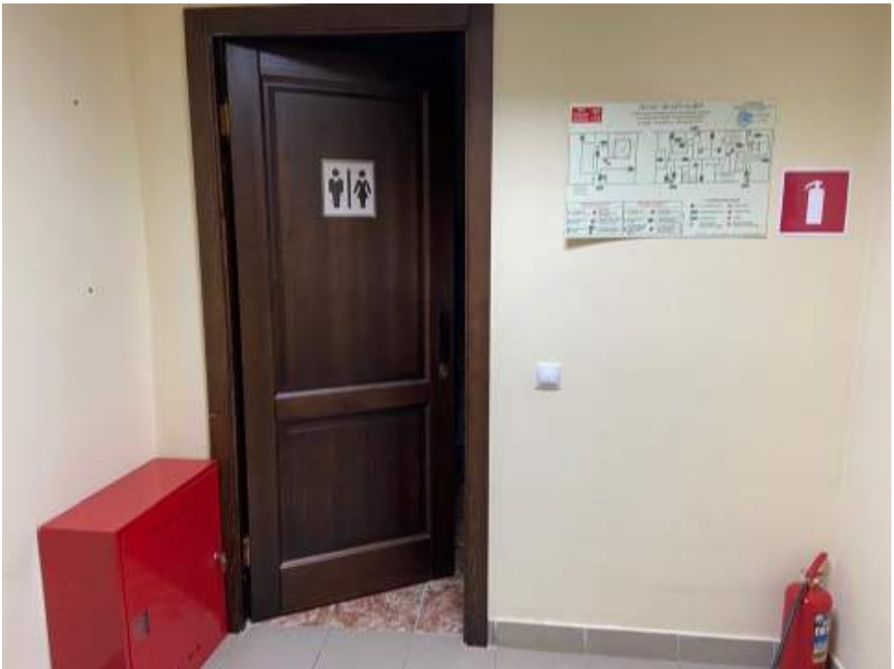
Рисунок 5.1. Вход в санузел