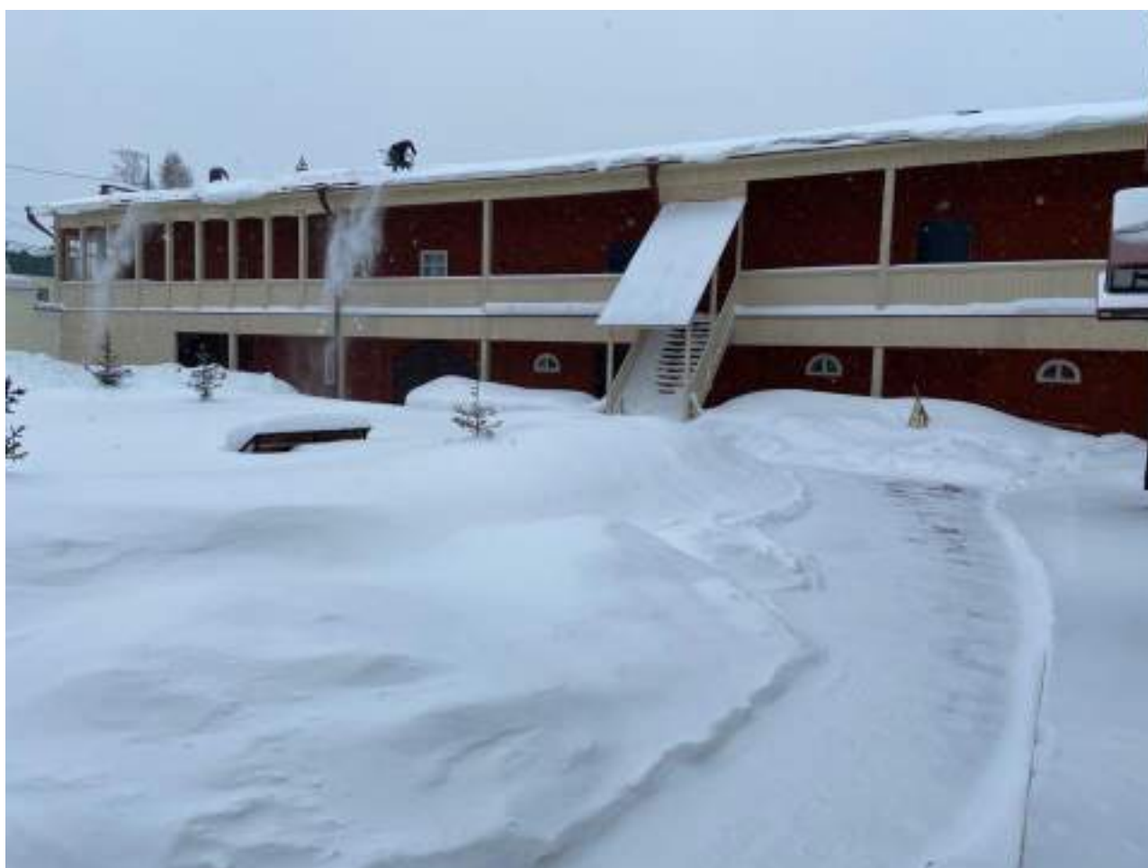
Рисунок 1.6 Пути движения на территории