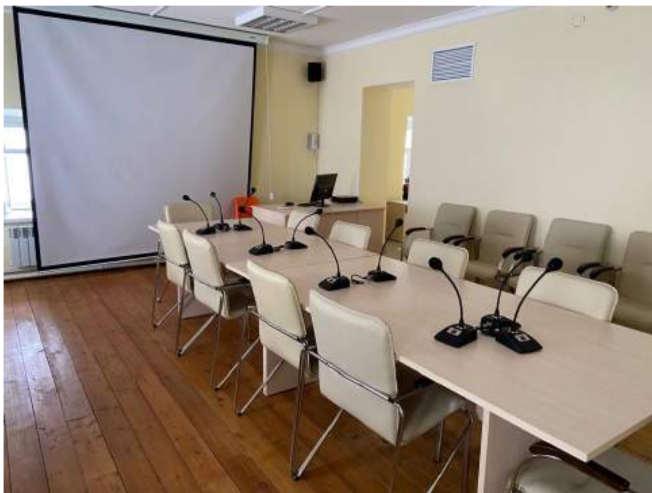
Рисунок 4.3. Конференц-зал на первом этаже