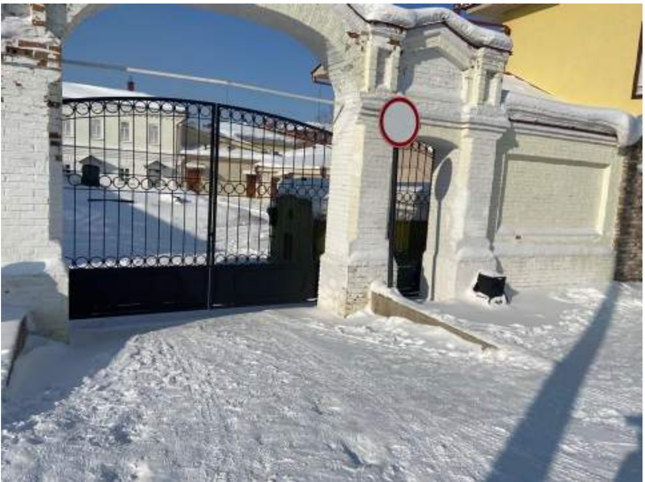
Рисунок 1.2 Вход на территорию объекта