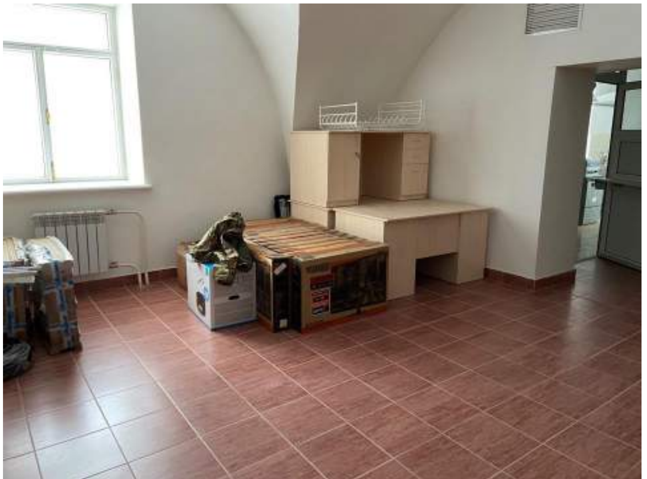
Рисунок 4.9 Кафе