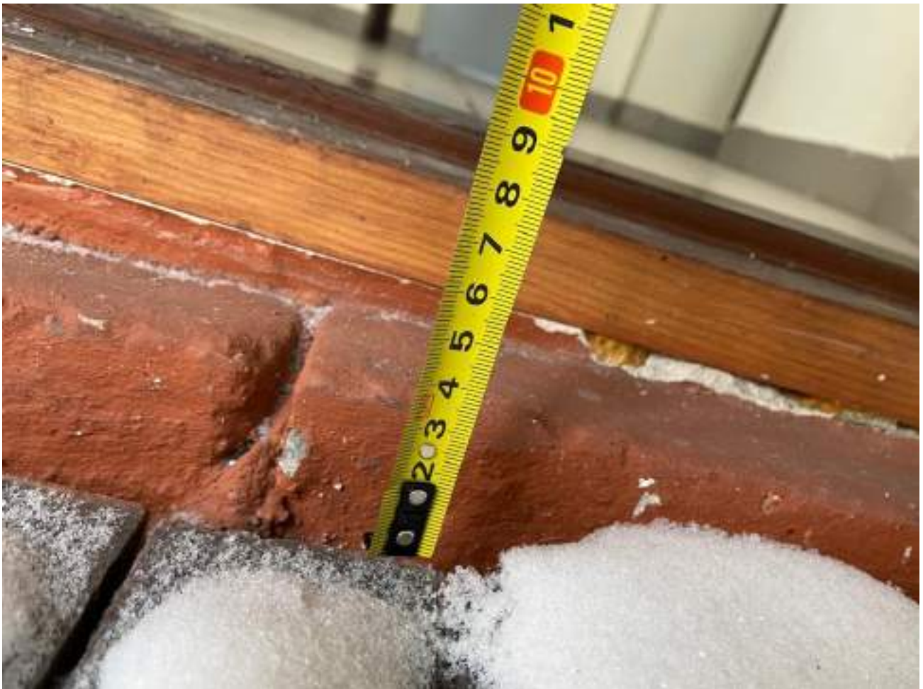
Рисунок 3.15 Дверной порог эвакуационного выхода 9 см