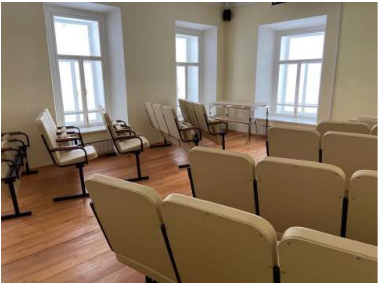
Рисунок 4.5 Конференц-зал на втором этаже