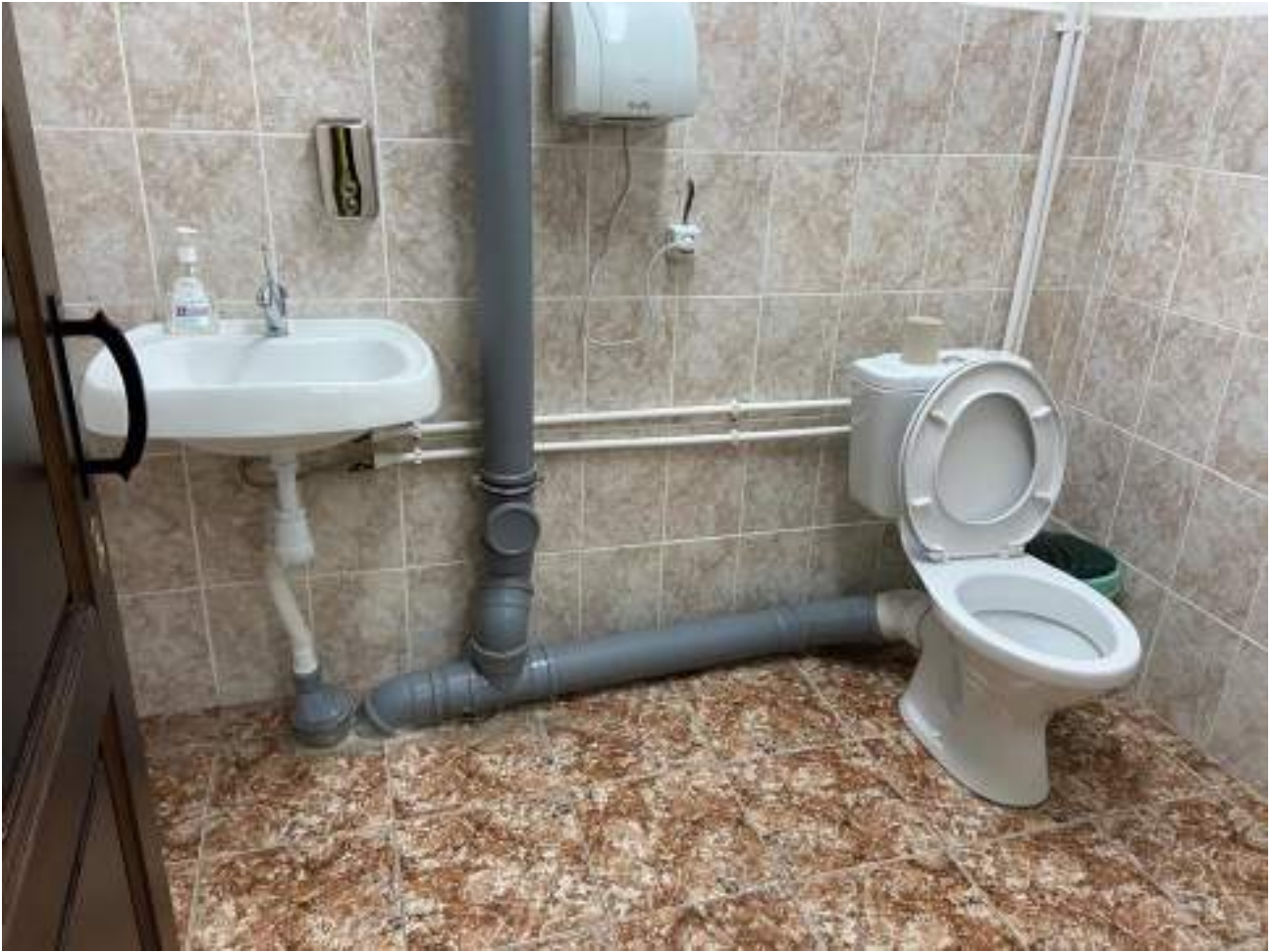
Рисунок 5.3. Кабина санузла