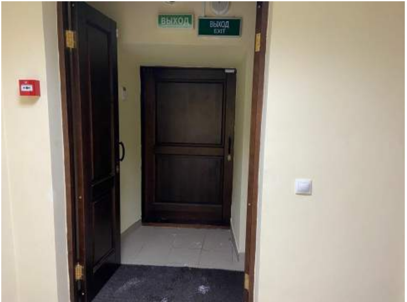
Рисунок 2.8 Тамбур