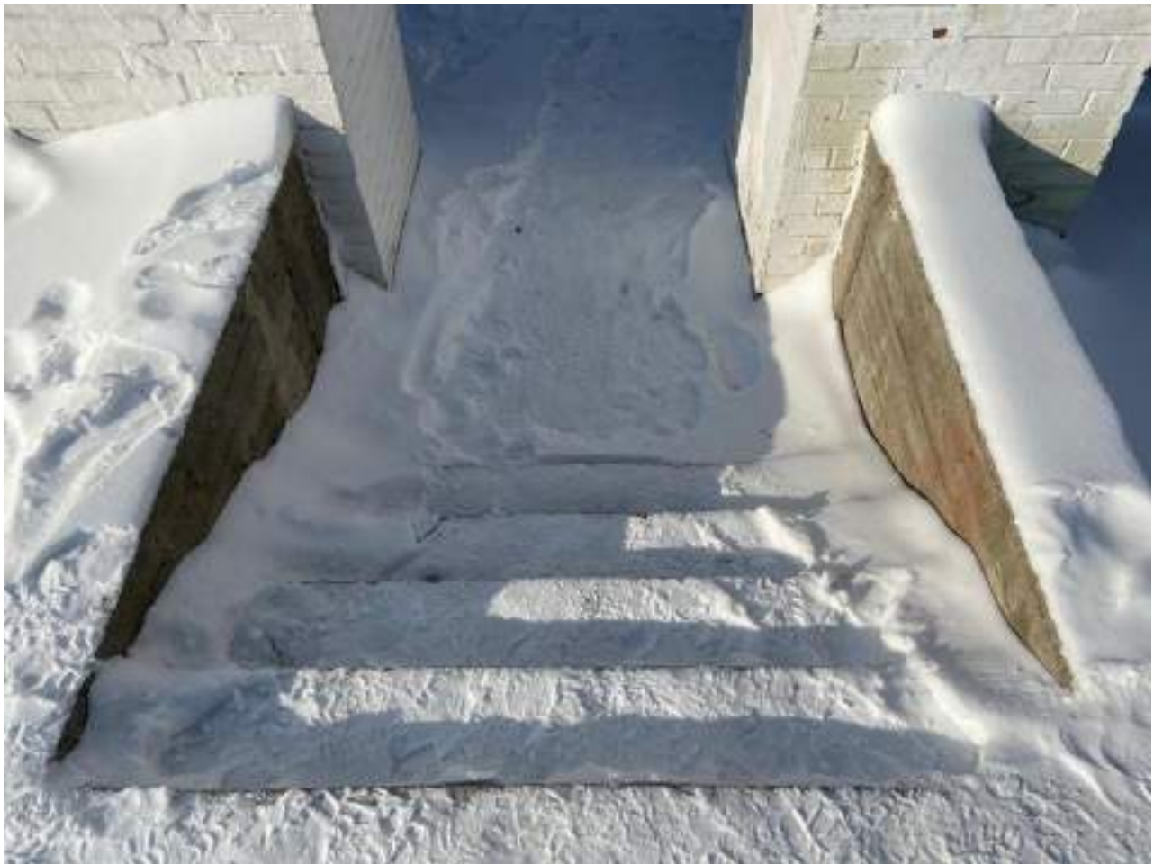
Рисунок 1.9 Лестничный марш при входе на территорию