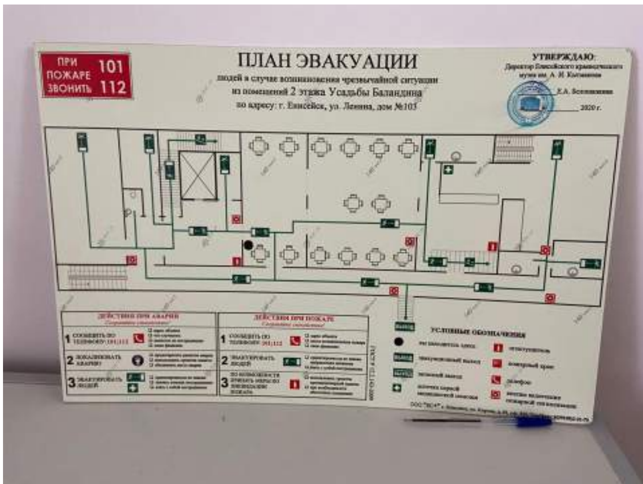
Рисунок 6.2. План эвакуации 2 этажа