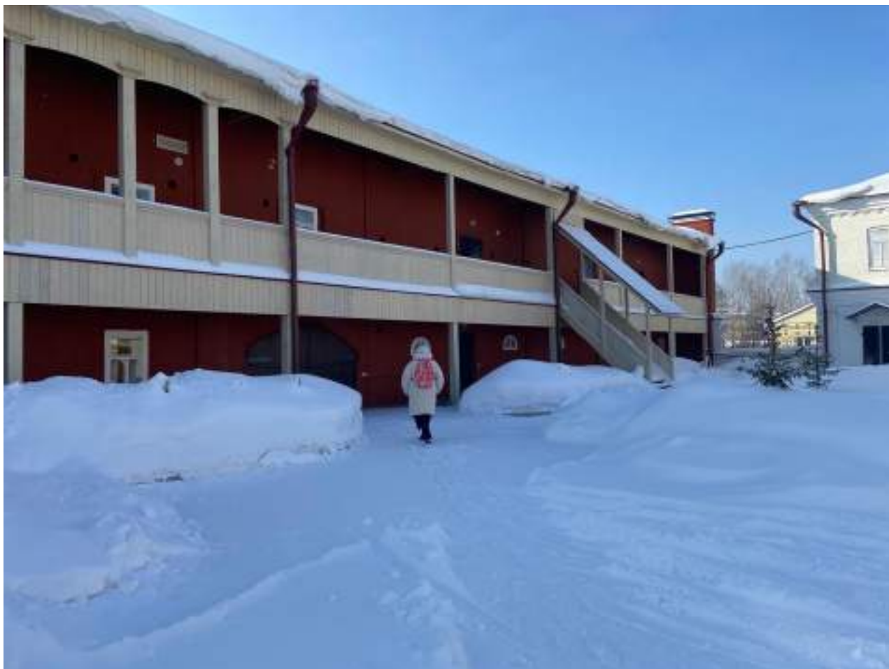
Рисунок 1.5 Пути движения на территории