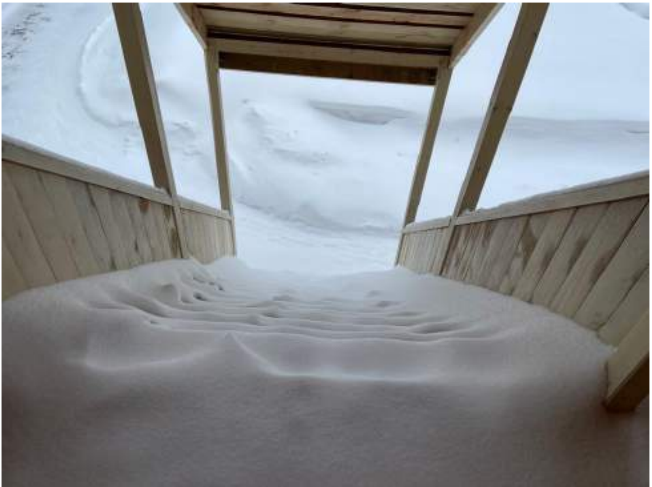
Рисунок 2.2 Лестничный марш при входе в кафе. Вид сверху