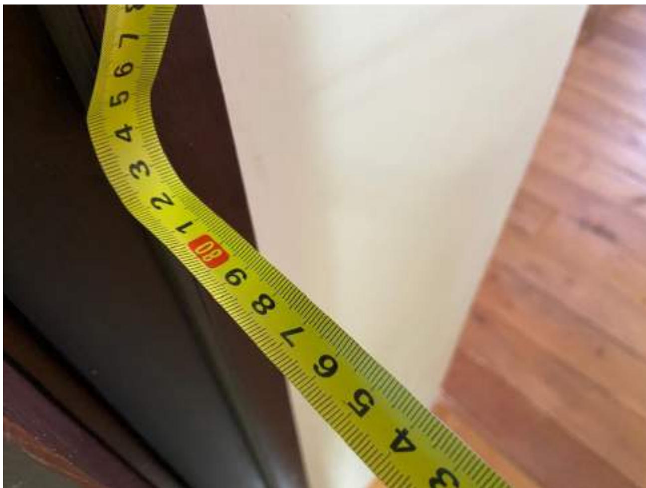
Рисунок 4.2. Ширина дверного проема 82 см