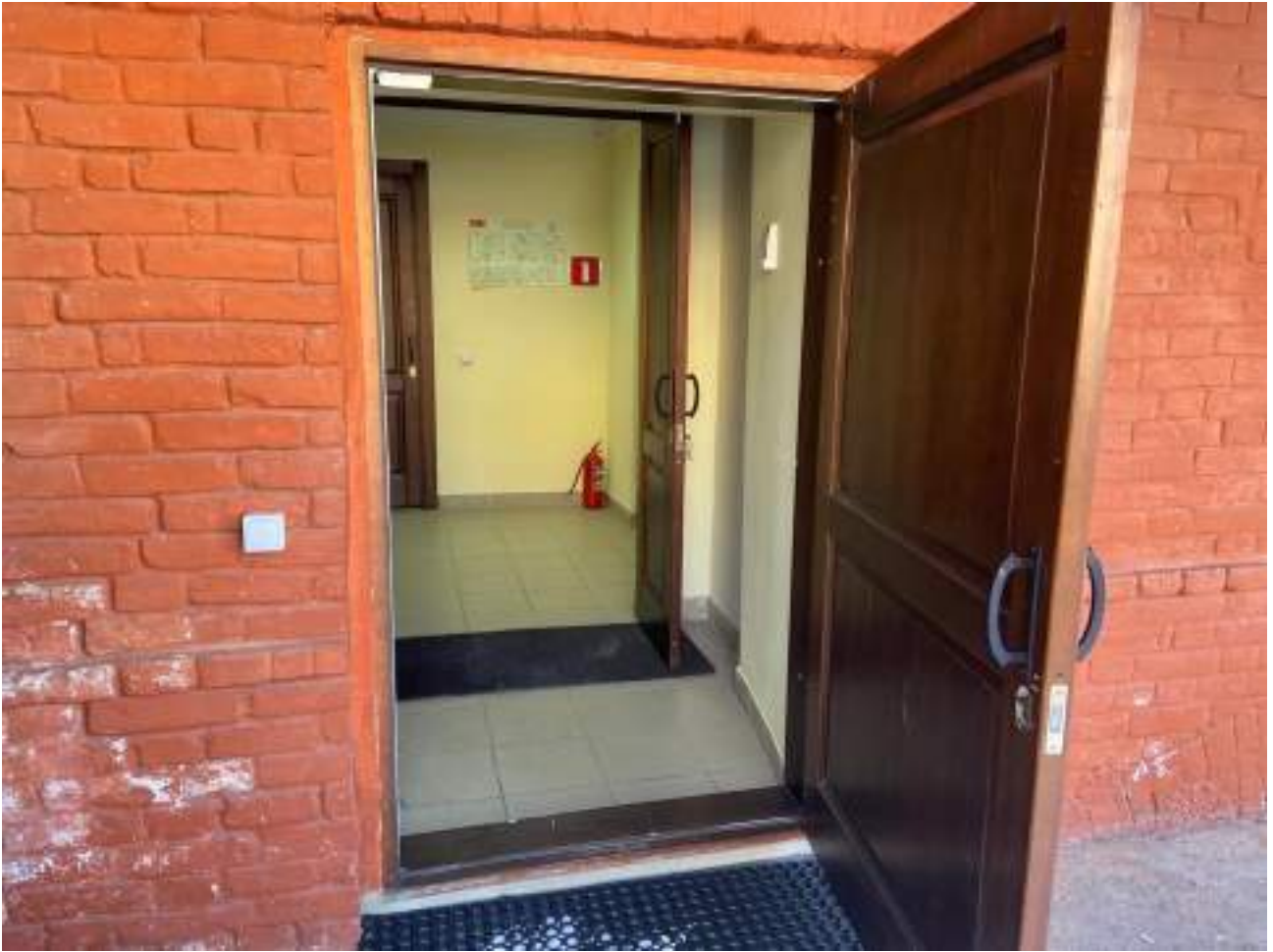
Рисунок 2.3 Вход в здание