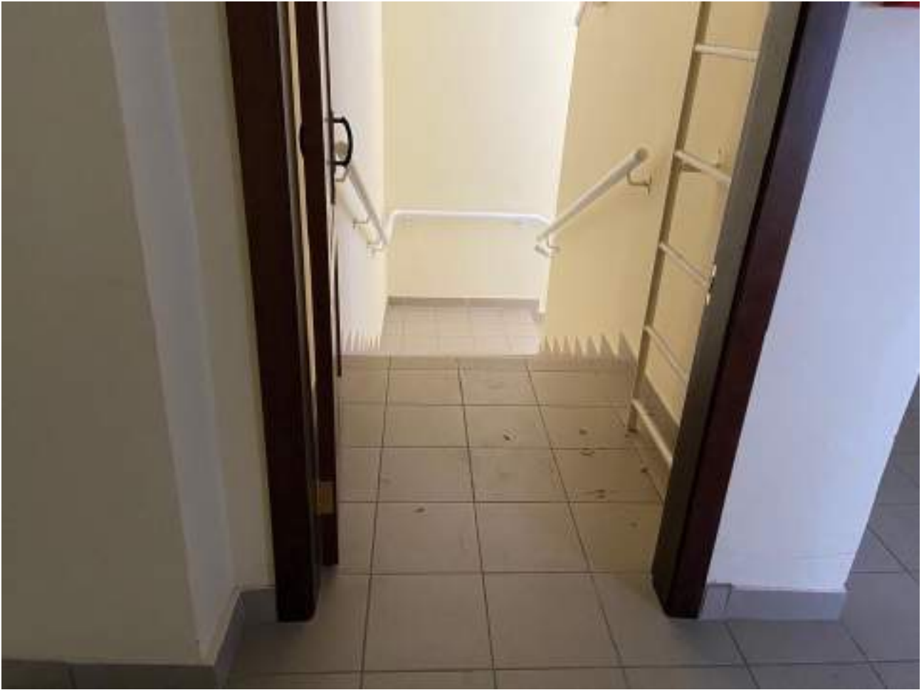
Рисунок 3.7 Лестничный марш. Выход со второго этажа