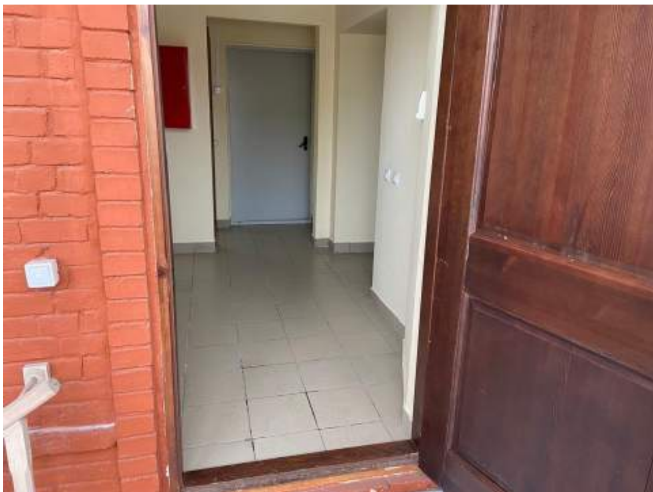
Рисунок 3.13 Эвакуационный выход на втором этаже