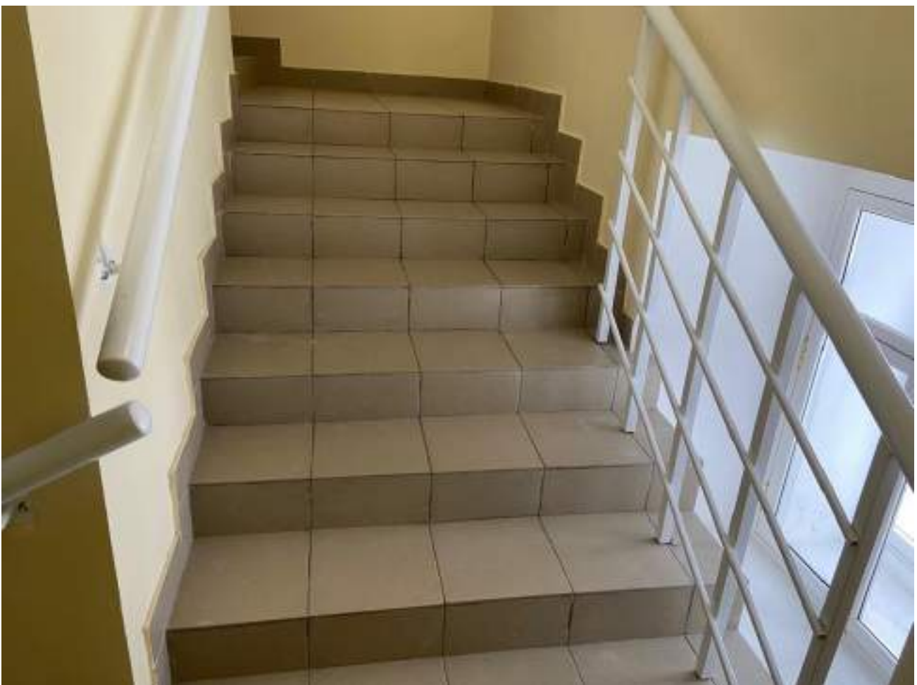
Рисунок 3.6 Лестничный марш внутри здания