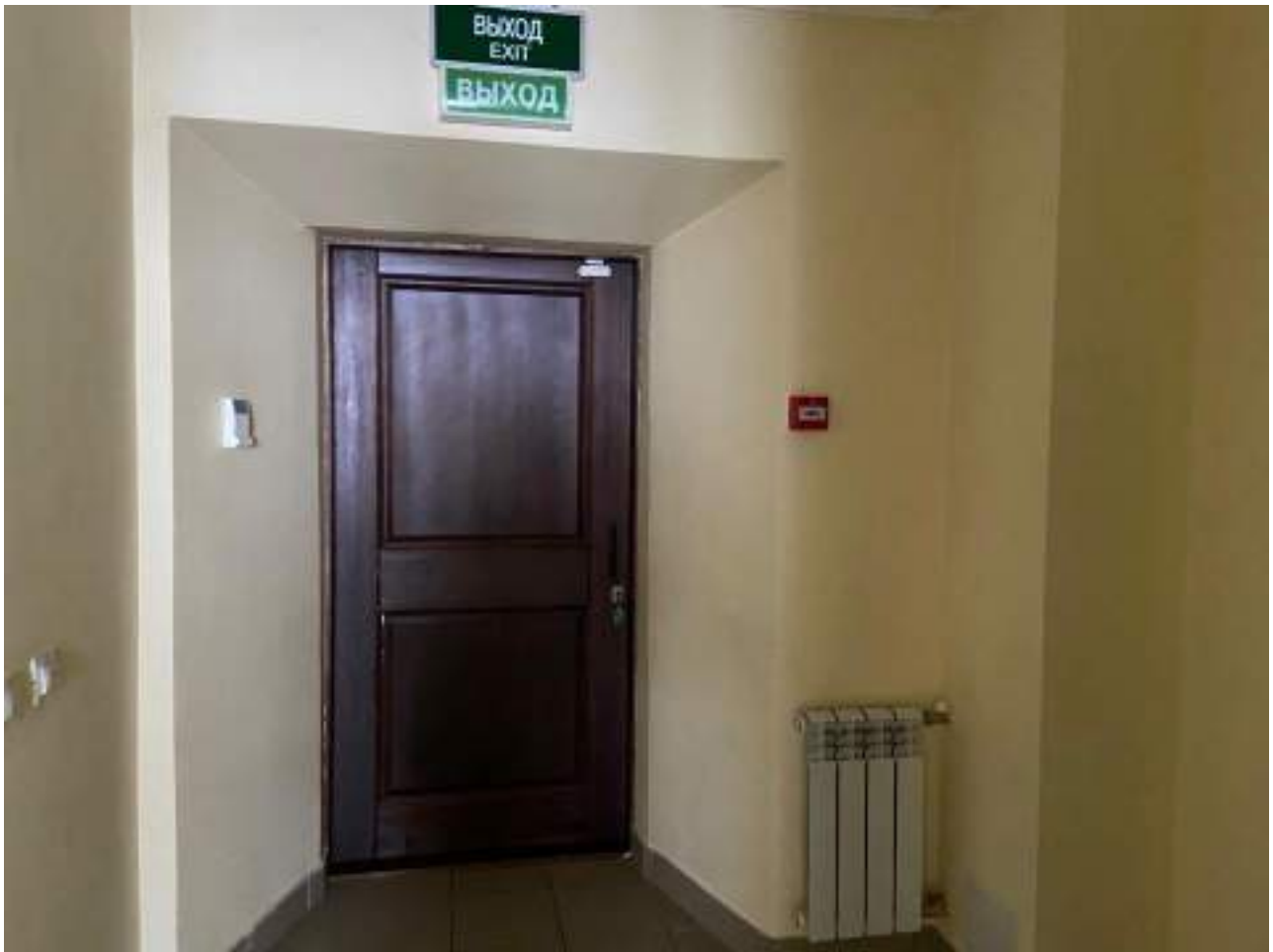
Рисунок 3.11 Эвакуационный выход на втором этаже