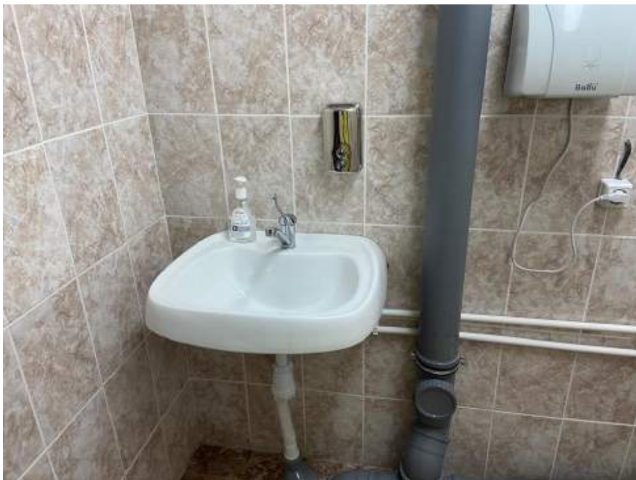
Рисунок 5.5. Раковина в санузле