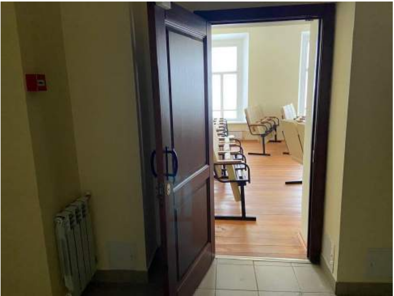
Рисунок 4.4. Конференц-зал на втором этаже