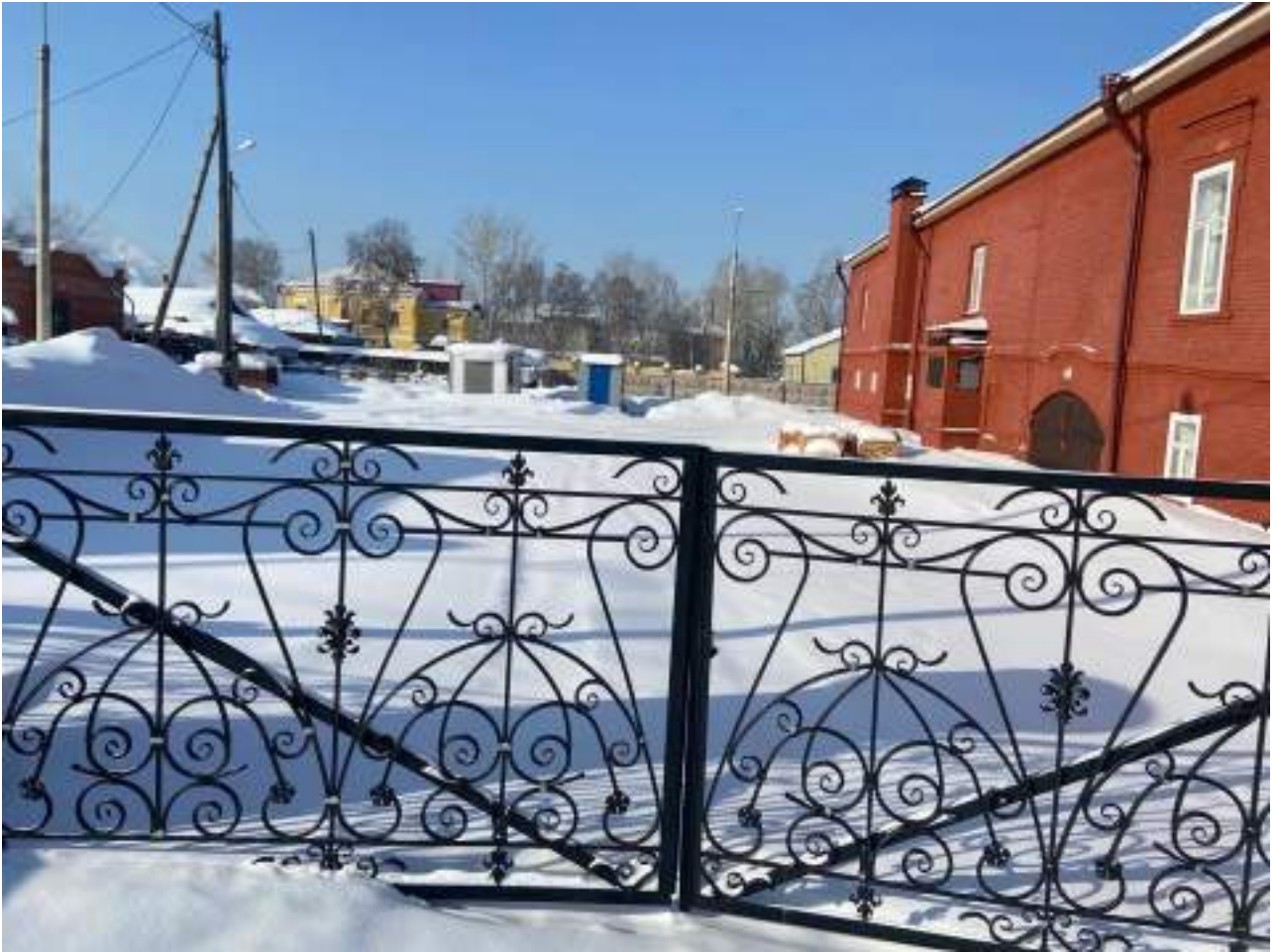
Рисунок 1.11 Парковочная зона