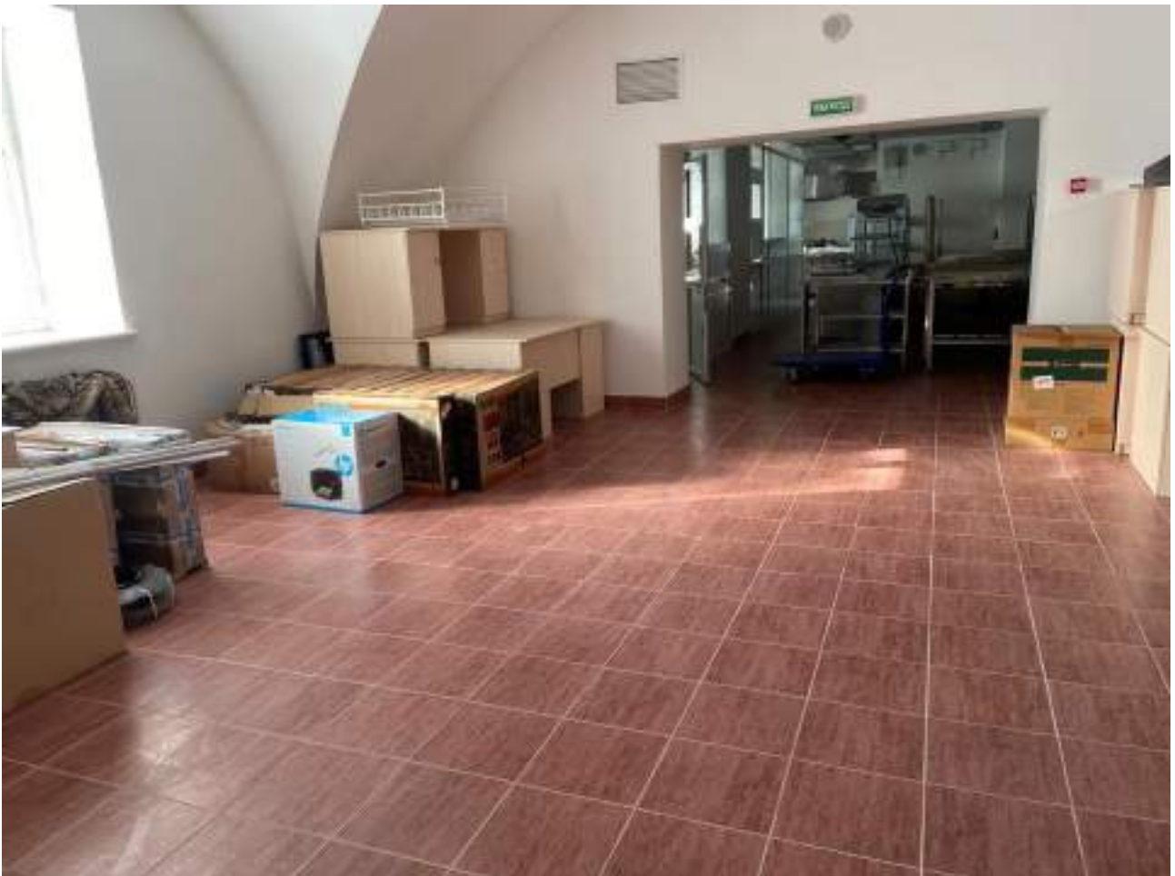
Рисунок 4.7 Кафе на втором этаже